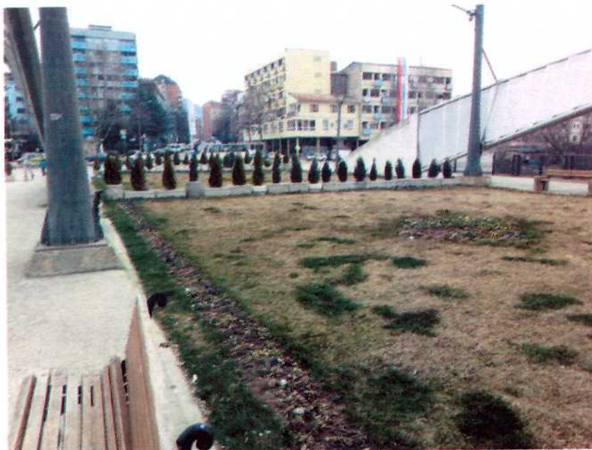
Slika 1: "Park Mira", nad mostom reke "Ibar"