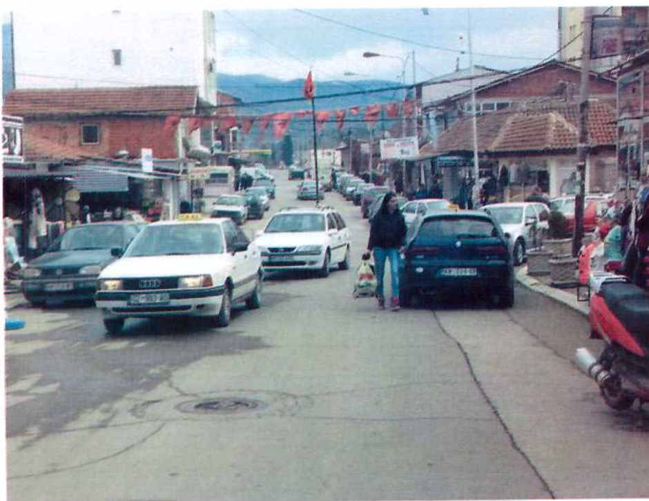
Slika 4: "Trg Adem Jashari", u Bošnjačkoj mahali , u severnoj Mitrovici