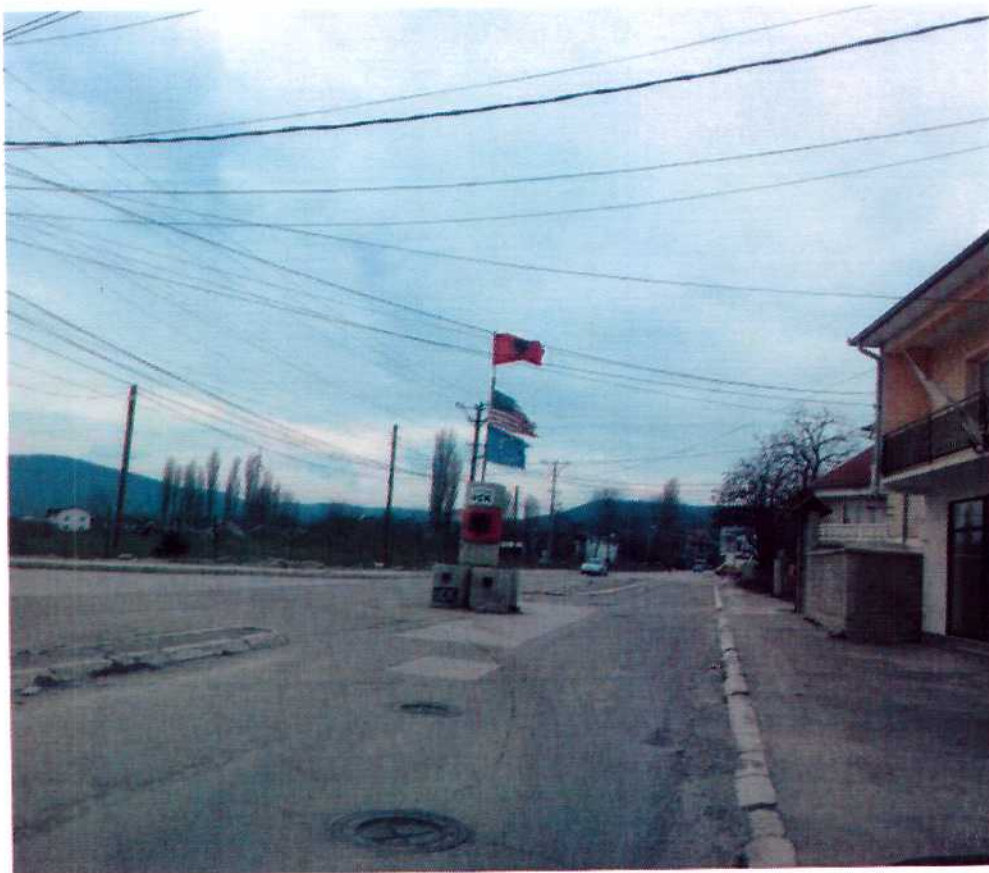
Slika 5: "Trg OVK" na ulazu u selu Sudohol u Severnoj Mitrovici