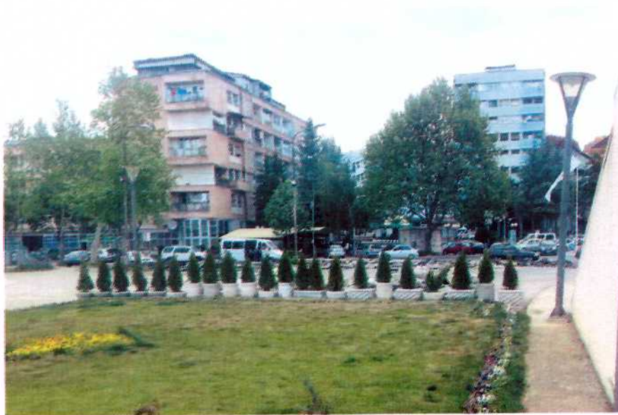
Slika 3: "Park Mira", sa "Trgom Cara Lazara"u pozadini