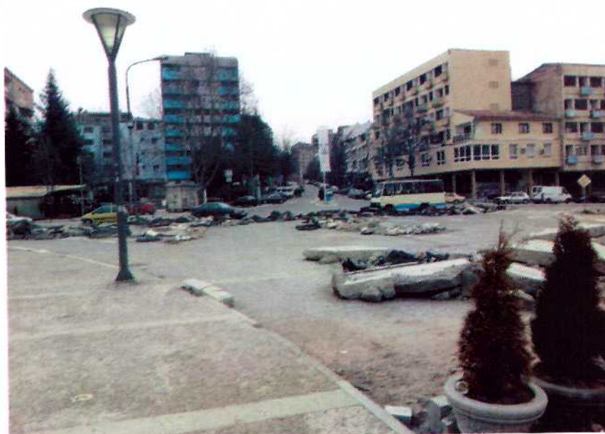
Slika 2: "Trg Car Lazar" ispred mosta na reci "Ibar" na severnoj strani